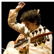
Partho Sarothy Calcutta, INDIA

La nuova musica dell'equilibrio a Padova